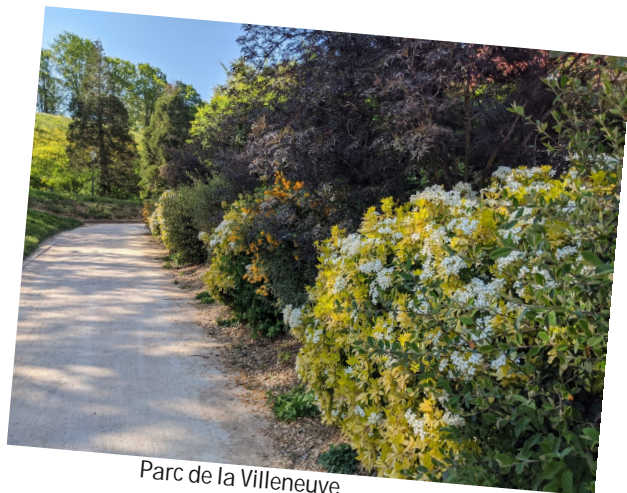
Parc de la Villeneuve

Les haies jouent un rôle essentiel d'habitat, de ressource et de corridor pour la faune et la flore. Seulement, celles-ci sont malheureusement elles aussi trop souvent « stériles », par le choix d'essences exotiques (lauriers, chalefs...), la faible diversité des essences plantées et un entretien très strict qui ne laisse pas de place aux floraisons et à la fructification.